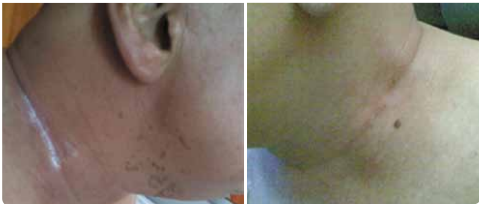
Ensayos clínicos realizados en el Hospital Huy (Francia)